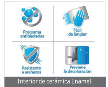
Interior de cerámica Enamel