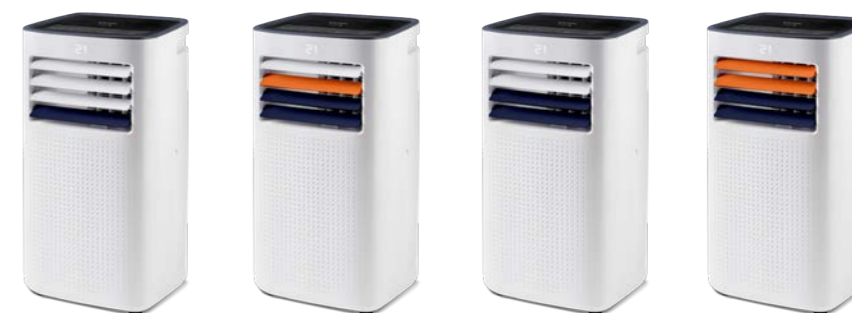
COLD DESIGN TEMP DESIGN COLD DESIGN + TEMP DESIGN +

Kit incluido para salida de aire caliente, para ventanas colgantes y correderas. Kit de janela para saída de ar quente incluído (janelas em guilhotina e de correr) MANGUERA (diámetro-largo): Ø 15 cm / ± 1,5 m MANGUEIRA (diâmetro-comprimento)