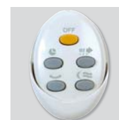
ARTIC-405 PRC GR: mando a distancia.