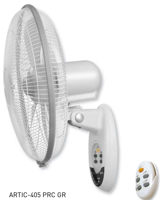
ARTIC-405 PRC GR

Ventiladores de pared que disponen de 3 velocidades, temporizador y reja de seguridad desmontable.