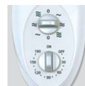
ARTIC-405 PM GR: selector de velocidades y temporizador.