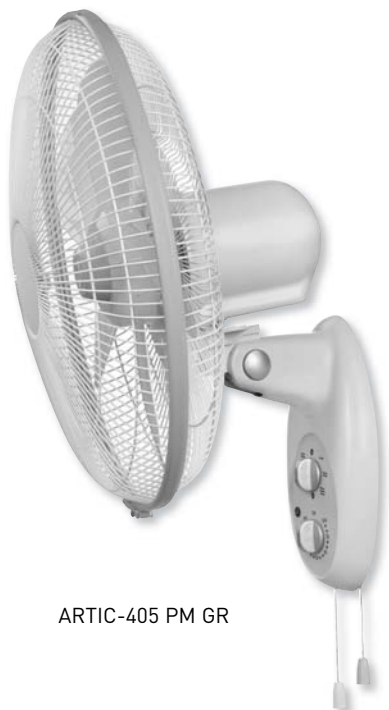
ARTIC-405 PM GR