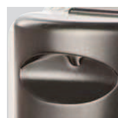
Asa para transporte