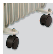
Ruedas para transporte