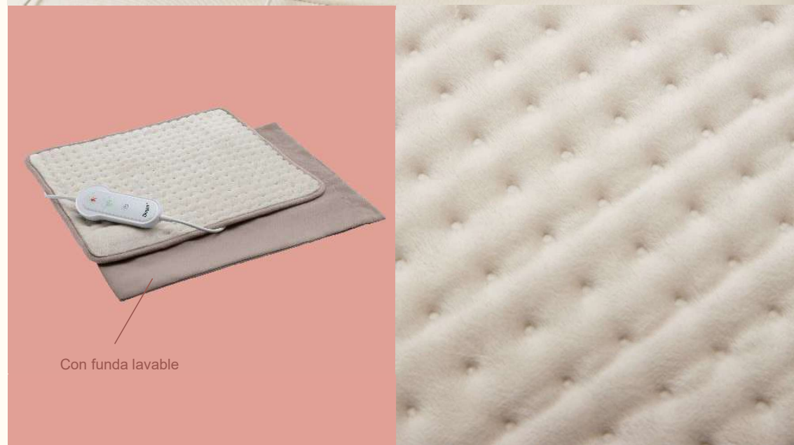
Con funda lavable