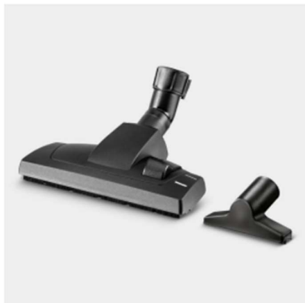
Accesorios especiales para la limpieza de distintos tipos de suelo y muebles tapizados

El objetivo son unos resultados de limpieza óptimos. Para obtener una máxima comodidad y flexibilidad al aspirar.