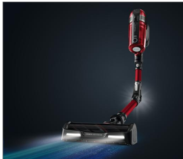
X-FORCE FLEX 12.60 ANIMAL CARE Aspiradora sin cable RH98A9WO