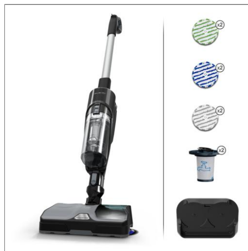
X-COMBO Aspiradora híbrida GZ3039WO