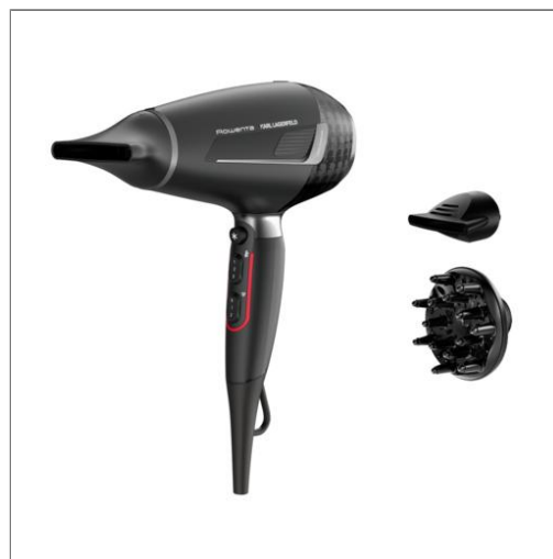
K/PRO STYLIST Secador de pelo motor AC CV887LF0